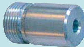
Buse EK 3