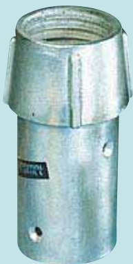
DH 328 GF