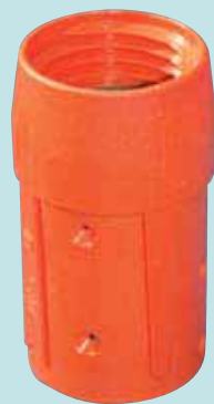
NH 32 GF